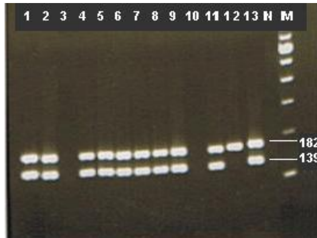
Gambar 3. Hasil Elektroforesis pada gel agarosa untuk melihat gen dtxR , pada angka 139 bp dan 182 bp nampak pita tebal yang menunjukkan isolat mengandung gen dtxR (Sunarno et al. , 2013).

struktur proteinya dan penyusun asam amino serta nukleotidnya maka toksin ini kebanyakan didominasi oleh basa nitrogen G-C (Sauvè et al. , 2018).